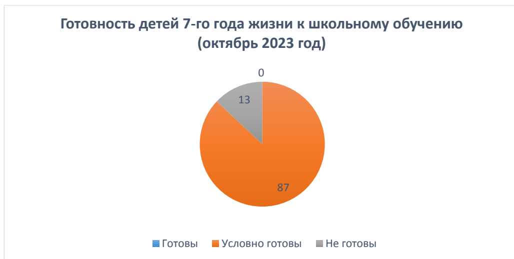
Рис. 4 Готовность детей 7-го года жизни к школьному обучению (октябрь 2023 год)

Анализ обследования показал, что есть такие области знаний, в которых дети в недостаточной мере ориентируются в окружающем мире, слабо развиты восприятие, память произвольное внимание, способность делать умозаключения, сравнивать, сопоставлять, составлять рассказ по серии картинок. В ходе проведенного исследования были выявлены эмоционально-личностные проблемы у воспитанников. Часть детей не справилась с графическим диктантом. Это говорит о нарушениях в области перцептивной и моторной организации.