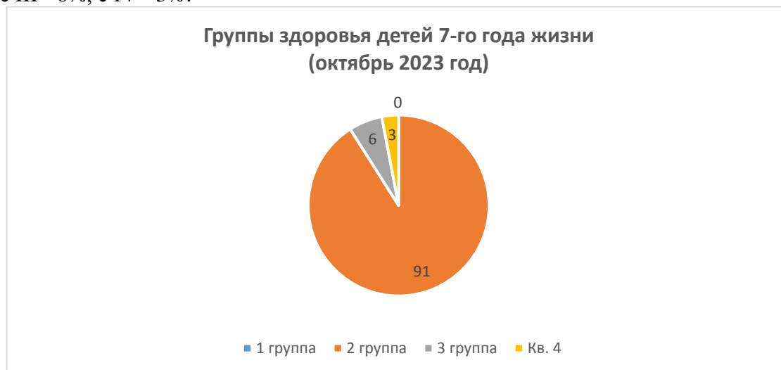
Рис.1. Группы здоровья детей 7-го года жизни (октябрь 2023 год)

Показатели по группам здоровья воспитанников 7-го года жизни выглядят следующим образом: детей с I группой здоровья не обнаружено, со II группой здоровья - 91%, с III - 6%, с IV - 3%.