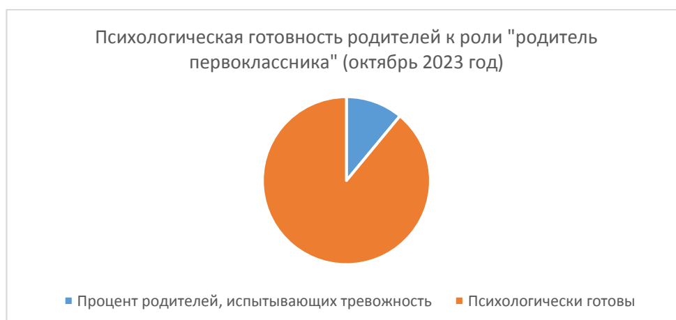
Рис. 5 Психологическая готовность родителей к роли «родитель первоклассника» (октябрь 2023 год).

Из анкетирования видно, что некоторые родители испытывают тревожность по поводу социального аспекта подготовки к школе - 11%, психологической готовности - 5%, индивидуальных особенностей ребенка - 5%. Родители не всегда понимают необходимость нравственной и психической готовности детей к обучению в школе. Многие родители считают, что их ребенок готов к обучению в школе только потому, что знает цифры и буквы.